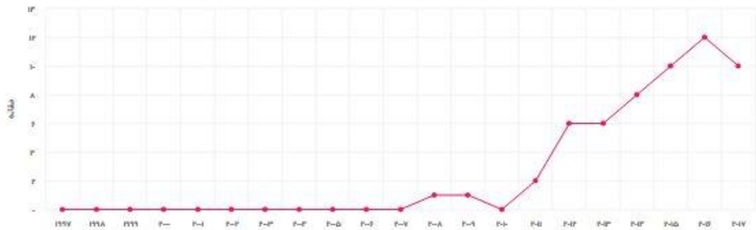
تعداد مقالات منتشر شده در سال مشخص

استادان (تفکیک سال چاپ) | استادان (تفکیک سال استناد) | H-index | G-Index | استاد به ازای مقاله | درصد خود استادی